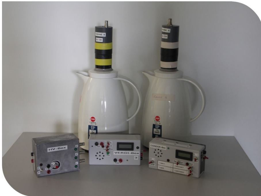
Abbildung 1: Bestandteile der kosmischen Kanne

Mit der kosmischen Kanne können Myonen detektiert und gezählt werden. Die Myonen sind Elementarteilchen, die nach dem Standardmodell mit den Elektronen verwandt sind, sie entstehen durch Einwirkung der kosmischen Strahlung auf die oberen Schichten der Atmosphäre.